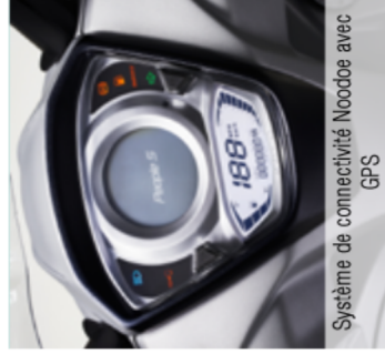
Système de connectivité Noodoe avec GPS