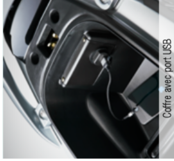
Coffre avec port USB