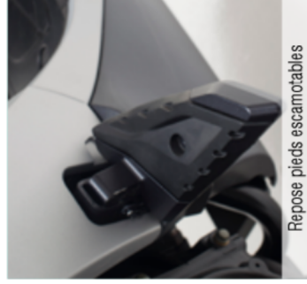
Repose pieds escamotables

Des grandes roues, des équipements premium et un look unique et élané, le People S 125 ne laisse rien au hasard. Il est idéal pour évoluer en milieu urbain et se faufiler entre les véhicules grâce à son agilité et à sa maniabilité exceptionnelle. Le People S 125 procure une sensation de confort remarquable et vous permettra de vivre chaque trajet comme un véritable moment de plaisir.