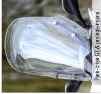
Pare-brise GT & protège-mains