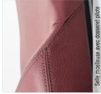
Selle moelleuse avec dossier pilote